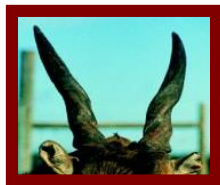
Eland (Elandantilop) Afrika

Vad man kan göra mer är att fråga barnen om varför djuren ser ut som de gör, tex. varför eland har stora horn, varför kamelen har pucklar, varför ormen har kluven tunga, varför påfågelhanen har så stor stjärt, varför lemuren har lång svans och sebror är randiga. Se exempel nedan