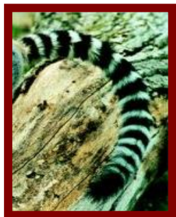
Lemur (Ringsvanslemur) Afrika (Madagaskar)

Pucklarna lagrar fett (inte vatten!) så den klarar sig länge utan mat och vatten